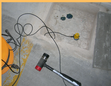
Figure n°1 : Mise en œuvre des massifs en tête de fondations

Il s'agit d'une application dérivée de l'essai par impédance mécanique, habituellement utilisée pour le contrôle des fondations profondes dans les travaux neufs.