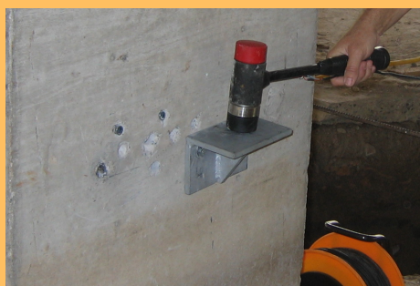
Figure n°2 : exemple d'instrumentation sur un poteau à la verticale de la fondation

L'essai est réalisé sur la tête de l'élément de fondation ou sur un élément à la verticale de celui-ci et auquel il est liaisonné.